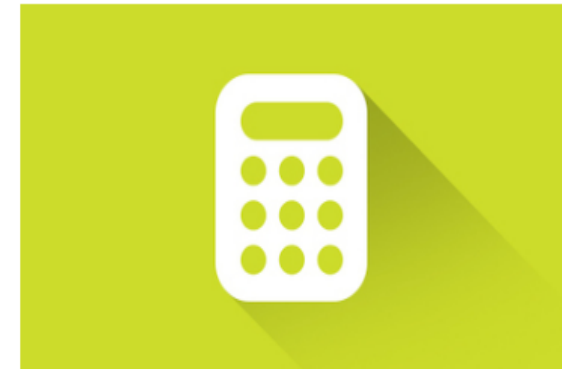
Simuladores de Créditos FOVISSSTE

Autor Fondo de la Vivienda del Instituto de Seguridad y Servicios Sociales de los Trabajadores del Estado